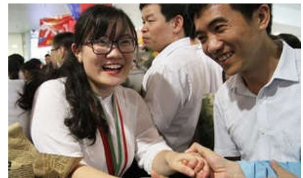
Cô gái lập kỷ lục cho đoàn Olympic Sinh học Việt Nam

Không phát hiện chênh lệch điểm sau chấm thẩm định ở Hòa Bình