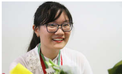
Nữ sinh làm nên lịch sử tại Olympic Sinh học quốc tế