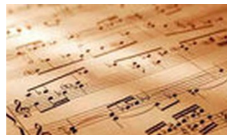
Lập danh sách ca khúc cấm thay vì cấp phép từng bài hát