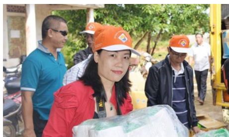
Hội Nhà báo đang làm rõ việc nữ nhà báo bị cấm xuất cảnh