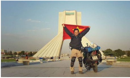
Đăng Khoa xin visa thế nào để đi vòng quanh thế giới?