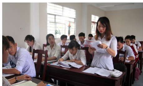
Xuất khẩu lao động: đi đâu, làm gì để có thu nhập cao?